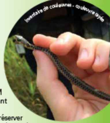
Inventaire de couleuvre - couleuvre fusée

Puis, dès 2016, une deuxième phase est enclenchée : la sensibilisation des voisins et des randonneurs à la valeur écologique des Boisés-Miner et à l'importance de protéger ce milieu. Pour y arriver, plusieurs outils sont déployés, notamment des panneaux d'interprétation, des activités éducatives et un guide d'information pour les propriétaires voisins de ce milieu fragile.