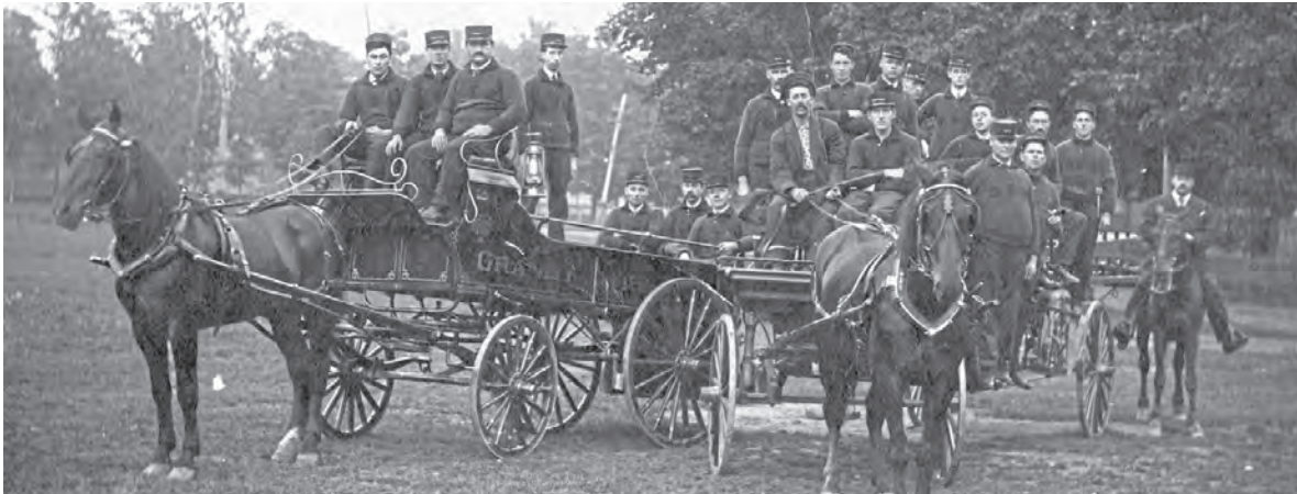
Nos brigades de police et d'incendie, vers 1914.

Une administration municipale à votre service depuis 1859